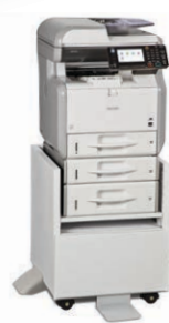
Bandeja Estándar con una Bandeja de 250 hojas y una de 500 hojas