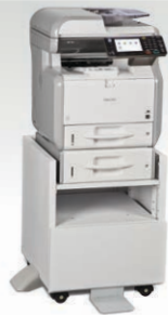
Bandeja Estándar con Bandeja de 500 hojas