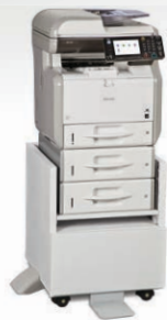
Bandeja Estándar con dos Bandejas de 500 hojas